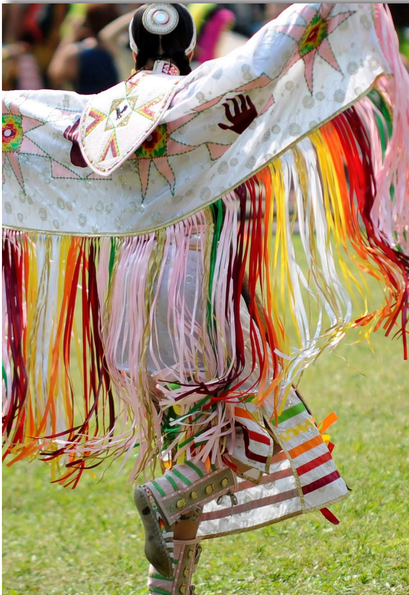
Un pow-wow à Kahnawà:ke.

« Ces femmes ont un attachement très fort à leur communauté malgré tout. Elles ont traversé la barrière invisible qui a été mise devant elles. »