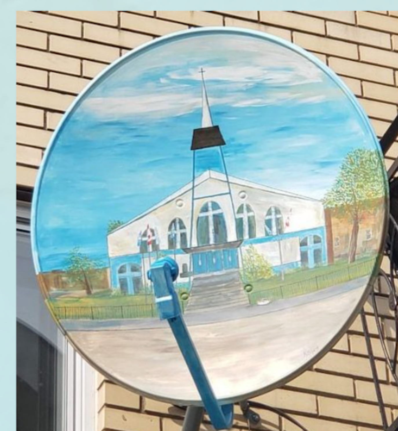
Artiste : Roxanna Kibsey

Pour rester informé sur les plus récentes nouvelles concernant notre forum, suivez-nous sur Twitter : @CoVivreQC