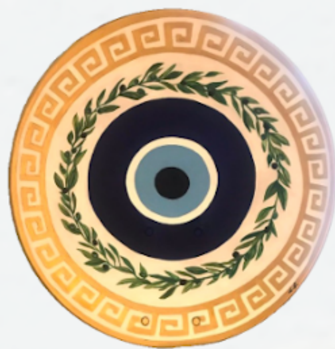
Artiste : Linda Luttinger (@linda_luttinger_lilu)

Les antennes de Parc Extension est une production artistique du Collectif Art Extension qui veut embellir les rues de Parc Extension en transformant les antennes satellites désaffectées qui ornent les bâtiments du quartier en toiles peintes vibrantes, mettant en valeur l'histoire, la diversité culturelle et le dynamisme artistique de Parc Extension et de Montréal.